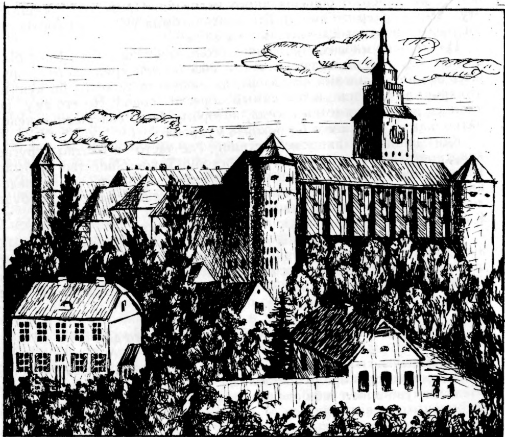
Вид на Королевский замок, слева дом Канта.