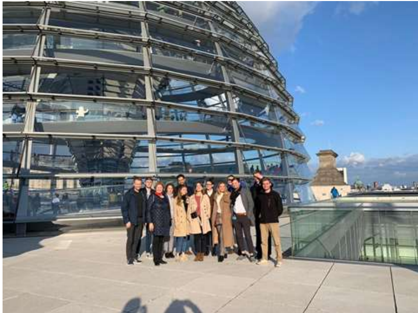
Besichtigung der Reichstagskuppel

Das zweite (und abschließende) Modul unseres erstmaligen Jugendprogramms „Auf den Spuren Kants in Kaliningrad - eine deutsch-russische Annäherung“ fand vom 4. bis 8. Oktober in Berlin statt.