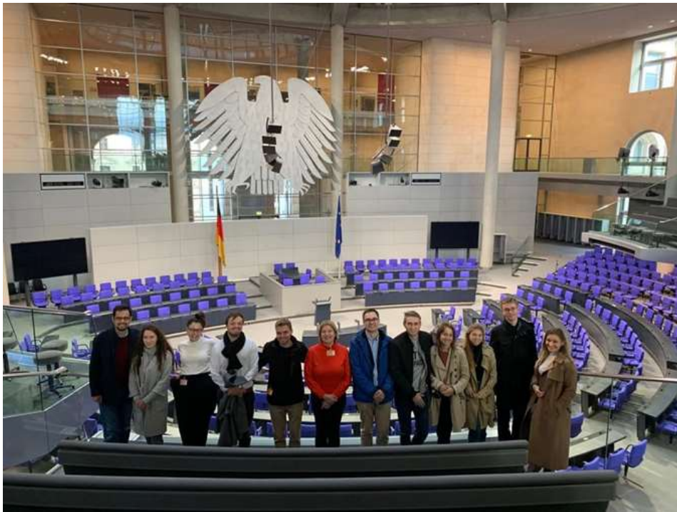
Besichtigung des Bundestags

Geheimen Staatsarchivs Preußischer Kulturbesitz, Tour durch Berlin auf einem Solar-Katamaran und eine Abendveranstaltung mit Vereinsmitgliedern, Gästen und mit einem Vertreter des Auswärtigen Amtes, das unser Jugendprogramm finanziell gefördert hat.