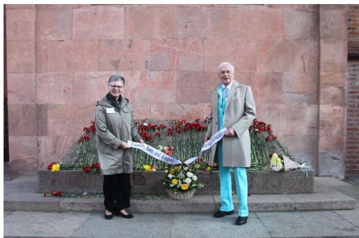
Blumenniederlegung am Grabe Immanuel Kants