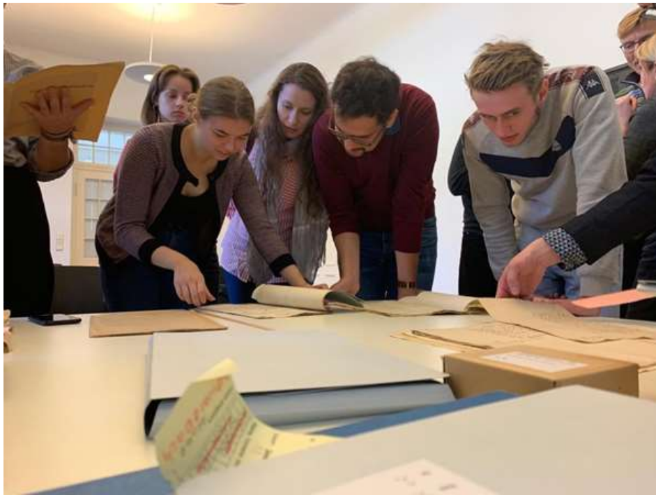
Teilnehmer des Jugendprogramms „Auf den Spuren Kants in Kaliningrad - eine deutsch-russische Annäherung" beim Workshop