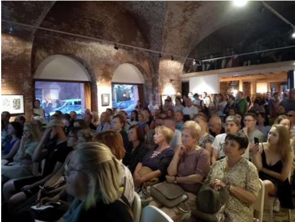
Sackheimer Tor in Kaliningrad