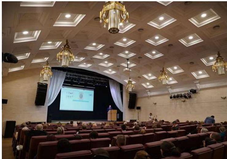
Kant-Konferenz im Kaliningrader Gebietsmuseum für Geschichte und Kunst (ehem. Königsberger Stadthalle)

Höhepunkte der 12. Kant-Reise waren der Besuch des Abschlusskonzerts der Absolventen des Rachmaninoff-Musikkollegs (frühere Bessel-Oberrealschule) am 18. April, die Kant-Konferenz im KGMGK am 19. April, an der auch zahlreiche Kaliningrader teilnahmen (die Vorträge und Diskussionsbeiträge wurden synchron übersetzt), der Besuch des Kant-Hauses in Judtschen/Wesselowka mit Zwischenaufenthalt in Insterburg/Tschernjachowsk am 20. April, die Schifffahrt von Pillau/Baltiysk über das Haff, den Seekanal und den Pregel zur Anlegestelle am Königsberger Dom am 21. April, der Festakt zum 295. Geburtstag Immanuel Kants im Königsberger Dom am 22. April sowie das anschließende Bohnenmahl im Restaurant „Grand Hall“, dem früheren Königsberger Eichamt.